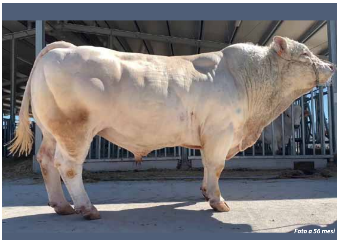
Foto a 56 mesi