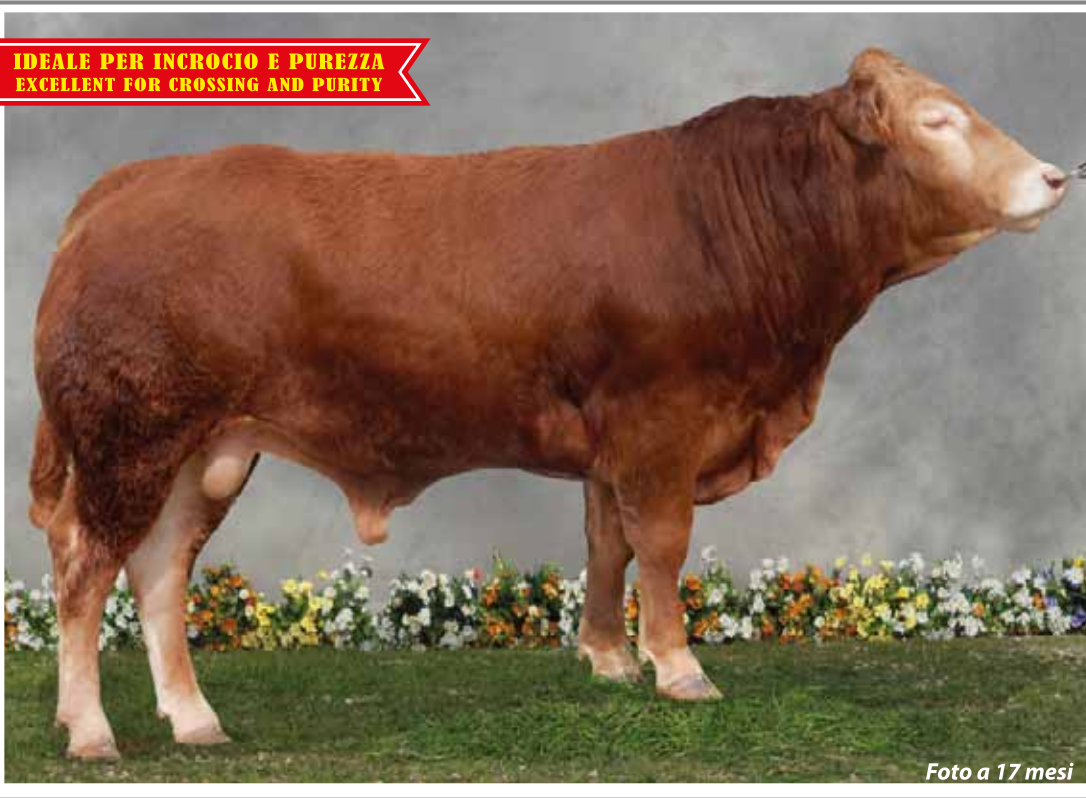
Foto a 17 mesi

IDEALE PER INCROCIO E PUREZZA EXCELLENT FOR CROSSING AND PURITY